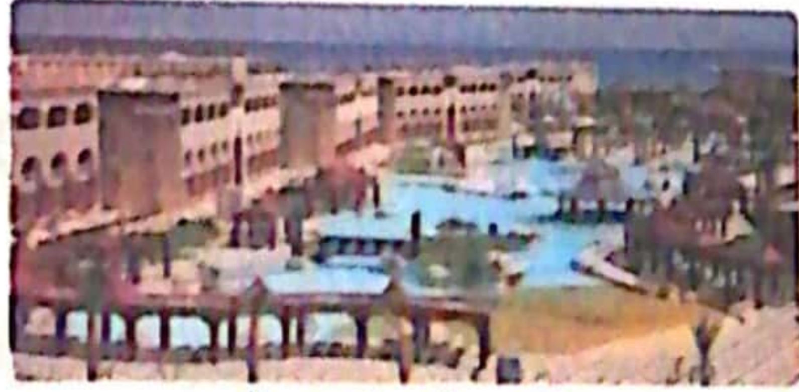
منتجع سياحى فى سيناء